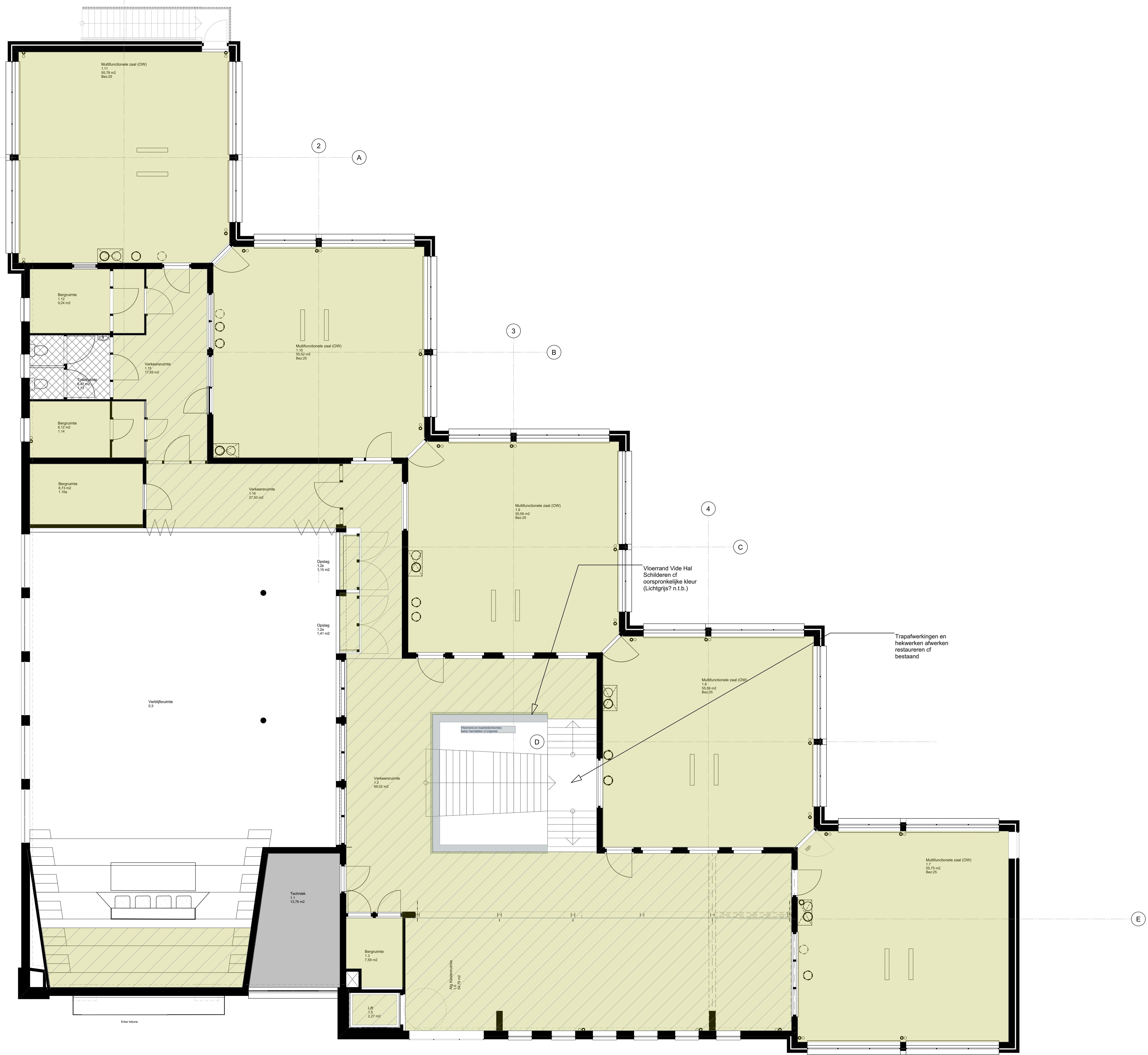
PLG V1 Vloerafwerkingen